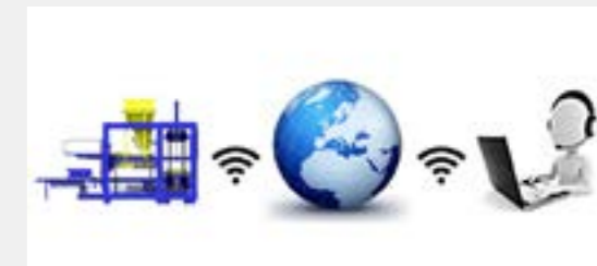
On-line wsparcie techniczne